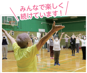
みんなで楽しく 続けています！

若葉台地区では、いつまでも自分らしく元気に暮らせるよう、地区内に住んでいる40～80歳前後の人を対象に、街ぐるみ健康づくり教室を開催しています。若葉台連合自治会が後援し、若葉台地区保健活動推進員が運営しています。健康寿命の延伸と仲間づくりを一人一人が楽しみながら、健康づくりを進めています。参加した人が新たな活動を始めるなど、地域の支え合いが広がっています。